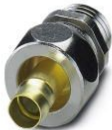
Prensaestopas de latón con rosca Pg, grado de protección IP40

Tenga en cuenta que los datos indicados aquí proceden del catálogo en línea. Los datos completos se encuentran en la documentación del usuario. Son válidas las condiciones generales de uso de las descargas por Internet. ( http://phoenixcontact.es/download )