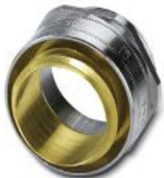
Prensaestopas de latón con rosca Pg giratoria, grado de protección IP40

Tenga en cuenta que los datos indicados aquí proceden del catálogo en línea. Los datos completos se encuentran en la documentación del usuario. Son válidas las condiciones generales de uso de las descargas por Internet. ( http://phoenixcontact.es/download )