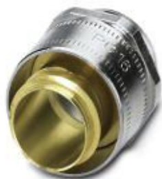
Prensaestopas de latón con rosca Pg giratoria, grado de protección IP40

Tenga en cuenta que los datos indicados aquí proceden del catálogo en línea. Los datos completos se encuentran en la documentación del usuario. Son válidas las condiciones generales de uso de las descargas por Internet. ( http://phoenixcontact.es/download )