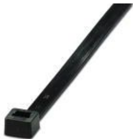
Sujetacables, versión estándar, para una agrupación rápida y segura

Tenga en cuenta que los datos indicados aquí proceden del catálogo en línea. Los datos completos se encuentran en la documentación del usuario. Son válidas las condiciones generales de uso de las descargas por Internet. ( http://phoenixcontact.es/download )