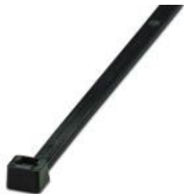
Sujetacables, versión estándar, para una agrupación rápida y segura

Tenga en cuenta que los datos indicados aquí proceden del catálogo en línea. Los datos completos se encuentran en la documentación del usuario. Son válidas las condiciones generales de uso de las descargas por Internet. ( http://phoenixcontact.es/download )