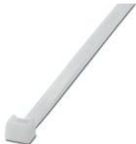
Sujetacables, versión estándar, para una agrupación rápida y segura

Tenga en cuenta que los datos indicados aquí proceden del catálogo en línea. Los datos completos se encuentran en la documentación del usuario. Son válidas las condiciones generales de uso de las descargas por Internet. ( http://phoenixcontact.es/download )