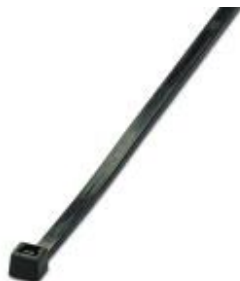
Sujetacables, versión estándar, para una agrupación rápida y segura

Tenga en cuenta que los datos indicados aquí proceden del catálogo en línea. Los datos completos se encuentran en la documentación del usuario. Son válidas las condiciones generales de uso de las descargas por Internet. ( http://phoenixcontact.es/download )