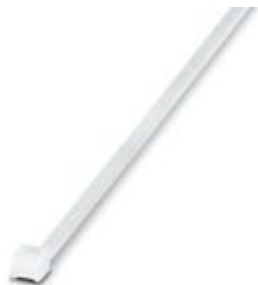
Sujetacables, versión estándar, para una agrupación rápida y segura

Tenga en cuenta que los datos indicados aquí proceden del catálogo en línea. Los datos completos se encuentran en la documentación del usuario. Son válidas las condiciones generales de uso de las descargas por Internet. ( http://phoenixcontact.es/download )