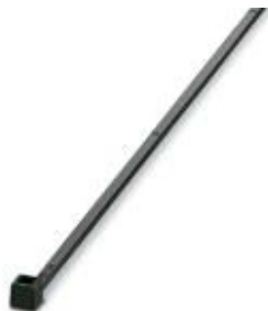
Sujetacables, versión estándar, para una agrupación rápida y segura

Tenga en cuenta que los datos indicados aquí proceden del catálogo en línea. Los datos completos se encuentran en la documentación del usuario. Son válidas las condiciones generales de uso de las descargas por Internet. ( http://phoenixcontact.es/download )