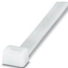
Sujetacables, versión estándar, para una agrupación rápida y segura

Tenga en cuenta que los datos indicados aquí proceden del catálogo en línea. Los datos completos se encuentran en la documentación del usuario. Son válidas las condiciones generales de uso de las descargas por Internet. ( http://phoenixcontact.es/download )