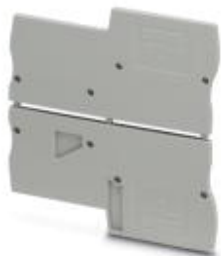
Tapa final, longitud: 74,9 mm, anchura: 2,2 mm, altura: 36,8 mm, color: gris

Tenga en cuenta que los datos indicados aquí proceden del catálogo en línea. Los datos completos se encuentran en la documentación del usuario. Son válidas las condiciones generales de uso de las descargas por Internet. ( http://phoenixcontact.es/download )