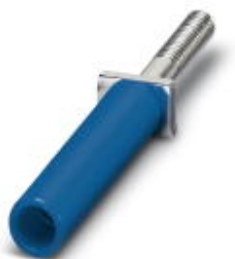
Hembra roscada, color: azul

Tenga en cuenta que los datos indicados aquí proceden del catálogo en línea. Los datos completos se encuentran en la documentación del usuario. Son válidas las condiciones generales de uso de las descargas por Internet. ( http://phoenixcontact.es/download )