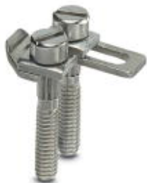
Eslabón puenteador, paso: 8,2 mm, número de polos: 2, color: plateado

Tenga en cuenta que los datos indicados aquí proceden del catálogo en línea. Los datos completos se encuentran en la documentación del usuario. Son válidas las condiciones generales de uso de las descargas por Internet. ( http://phoenixcontact.es/download )