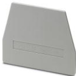
Tapa final, longitud: 61 mm, anchura: 2,2 mm, altura: 48,5 mm, color: gris

Tenga en cuenta que los datos indicados aquí proceden del catálogo en línea. Los datos completos se encuentran en la documentación del usuario. Son válidas las condiciones generales de uso de las descargas por Internet. ( http://phoenixcontact.es/download )