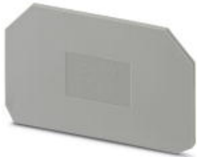
Tapa final, longitud: 72,6 mm, anchura: 2,2 mm, altura: 43,6 mm, color: gris

Tenga en cuenta que los datos indicados aquí proceden del catálogo en línea. Los datos completos se encuentran en la documentación del usuario. Son válidas las condiciones generales de uso de las descargas por Internet. ( http://phoenixcontact.es/download )