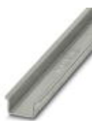
Carril simétrico sin perforar, Perfil estándar 2,3 mm, anchura: 35 mm, altura: 15 mm, según EN 60715, material: Acero, galvanizado, pasivado de capa gruesa, longitud: 2000 mm, color: plateado

Carril simétrico sin perforar - NS 35/15-2,3 UNPERF 2000MM - 1201798