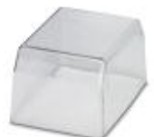
Tapa, para el encapsulado protegido contra suciedad y contactos accidentales de los componentes