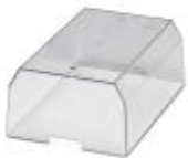
Tapa, para el encapsulado protegido contra suciedad y contactos accidentales de los componentes