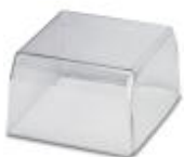
Tapa, para el encapsulado protegido contra suciedad y contactos accidentales de los componentes