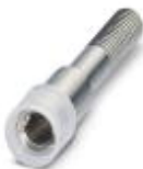
Hembra roscada, color: plateado