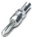
Clavija de pruebas, con conexión por soldadura hasta sección de cable de 1 mm 2 , color: gris