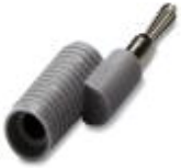
Clavija reductora, color: gris

Clavija de pruebas - PS-UK 2,5 B/E - 3001132