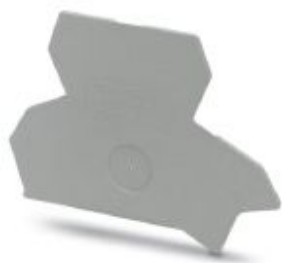
Tapa final, longitud: 72 mm, anchura: 1,5 mm, altura: 59 mm, color: gris

Tenga en cuenta que los datos indicados aquí proceden del catálogo en línea. Los datos completos se encuentran en la documentación del usuario. Son válidas las condiciones generales de uso de las descargas por Internet. ( http://phoenixcontact.es/download )