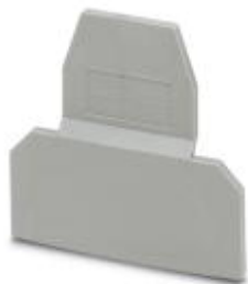
Tapa final, longitud: 56 mm, anchura: 2,5 mm, altura: 52 mm, color: gris

Tenga en cuenta que los datos indicados aquí proceden del catálogo en línea. Los datos completos se encuentran en la documentación del usuario. Son válidas las condiciones generales de uso de las descargas por Internet. ( http://phoenixcontact.es/download )