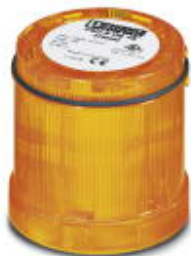
Elemento luminoso permanente, de 12 a 240 V AC/DC, amarillo, sin lámpara incandescente

Tenga en cuenta que los datos indicados aquí proceden del catálogo en línea. Los datos completos se encuentran en la documentación del usuario. Son válidas las condiciones generales de uso de las descargas por Internet. ( http://phoenixcontact.es/download )