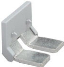
Peine puenteador, paso: 36 mm, número de polos: 2, color: gris

Tenga en cuenta que los datos indicados aquí proceden del catálogo en línea. Los datos completos se encuentran en la documentación del usuario. Son válidas las condiciones generales de uso de las descargas por Internet. ( http://phoenixcontact.es/download )