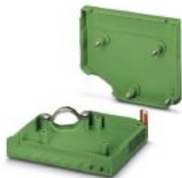
Carcasa de cables, paso: 0 mm, número de polos: 6, media a: 47,52 mm, color: verde

Tenga en cuenta que los datos indicados aquí proceden del catálogo en línea. Los datos completos se encuentran en la documentación del usuario. Son válidas las condiciones generales de uso de las descargas por Internet. ( http://phoenixcontact.es/download )