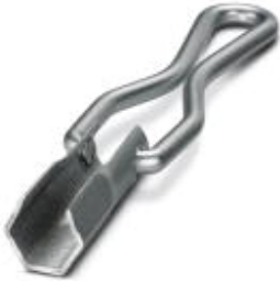
Llave tubular, para soltar y enroscar la tuerca de unión QUICKON, ancho entre caras 15 mm

Tenga en cuenta que los datos indicados aquí proceden del catálogo en línea. Los datos completos se encuentran en la documentación del usuario. Son válidas las condiciones generales de uso de las descargas por Internet. ( http://phoenixcontact.es/download )