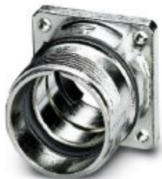
Carcasa empotrada, serie: RC, recto, Bloqueo por tornillo, M23, Anillo tórico radial, 4x Ø 3,2, apantallado: sí

Tenga en cuenta que los datos indicados aquí proceden del catálogo en línea. Los datos completos se encuentran en la documentación del usuario. Son válidas las condiciones generales de uso de las descargas por Internet. ( http://phoenixcontact.es/download )