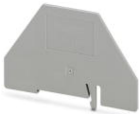
Placa separadora, longitud: 83 mm, anchura: 2 mm, altura: 60 mm, color: gris

Tenga en cuenta que los datos indicados aquí proceden del catálogo en línea. Los datos completos se encuentran en la documentación del usuario. Son válidas las condiciones generales de uso de las descargas por Internet. ( http://phoenixcontact.es/download )