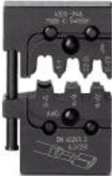
Matriz, para Crimpfox-M, para hembras de enchufe plano sin aislar

Tenga en cuenta que los datos indicados aquí proceden del catálogo en línea. Los datos completos se encuentran en la documentación del usuario. Son válidas las condiciones generales de uso de las descargas por Internet. ( http://phoenixcontact.es/download )