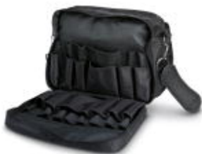
Maletín herramientas, con compartimento para portátil y documentos, sin equipar

Tenga en cuenta que los datos indicados aquí proceden del catálogo en línea. Los datos completos se encuentran en la documentación del usuario. Son válidas las condiciones generales de uso de las descargas por Internet. ( http://phoenixcontact.es/download )