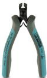
Alicates corte frontal p. electrónica ESD, sin chaflán, c. resorte de apertura

Tenga en cuenta que los datos indicados aquí proceden del catálogo en línea. Los datos completos se encuentran en la documentación del usuario. Son válidas las condiciones generales de uso de las descargas por Internet. ( http://phoenixcontact.es/download )